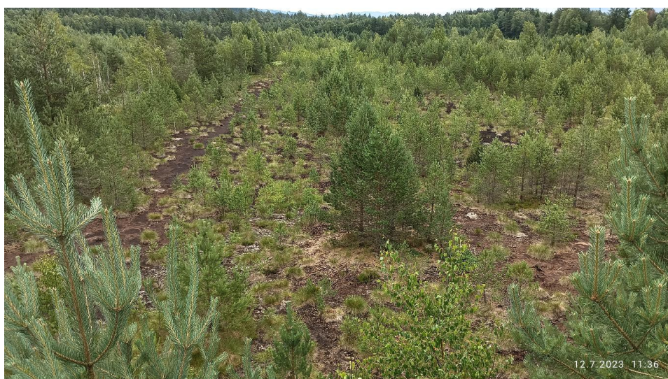
Pohled na část rekultivovaného rašeliniště