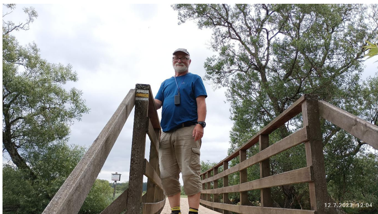
Klasická fotografie lávky u Dobré

Nakonec docházíme až k Němečkům. Trošku zklamání, protože oběd za 235Kč nebyl tím, čím býval. Zkrátka pokud hospoda nabízí hotové knedlíky plněné uzeným masem ve formě ohřátí těch z Billy (v mikrovlnce, takže kus knedlíku je vysušený horký a další studený) a to se ziskem 150 procent, pak opravdu tito zlatokopové se nesmí divit, že jim tam už příště nikdo nepřijde.